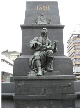
Сл. 2: Филип Вишњић на споменику косовским јунацима у Крушевцу

У Сријему, у Славонији, у Бачкој и у Банату слијепци наши слабо знаду јуначкијех пјесама, него пред кућама стојећи пјевају пјесмице побожне, да би њима људе на подјелу побудили, а на саборима (како код цркава и код манастира, тако и по варошима и по селима на панађурима и о празницима) посједају на земљу, па као пјевајући уз гусле моле, да им се што удијели. Прве ове пјесмице зову они преткућнице (или преткутњице, што се пјевају пред кућама), а друге клањалице (којима се људима клања и моли). Слијепац Филип Вишњић, кад је чуо у Сријему ове клањалице, подсмјивао се, говорећи: „Ваши слијепци не знаду ништа да пјевају, него само богораде уз гусле, и вичу: „„подарујте, обрадујте!““