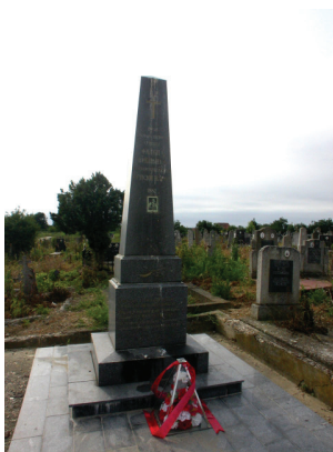
Сл. 6: Споменик Филипу Вишњићу у Вишњићеву