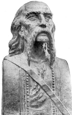
Сретен Стојановић: Филип Вишњић (Са пролећне изложбе у павиљону „Цветије Зузорић“ у мају 1937)

Слика 8 – Биста Филипа Вишњића, Сретен Стојановић, Београдске општинске новине , год. 55, бр. 4–6, април – јуни 1937, 396.