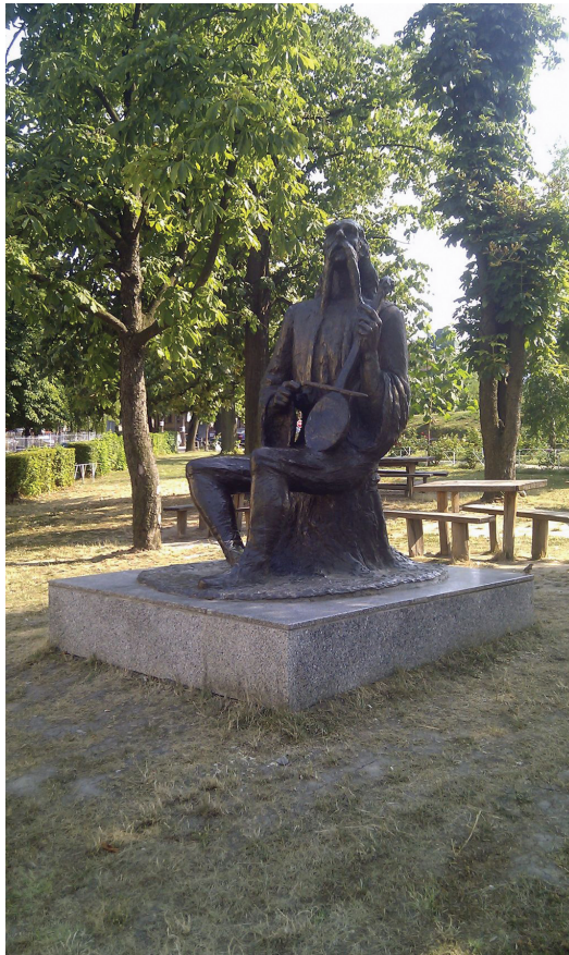
Сл. 4: Споменик Филипу Вишњићу у Лозници

Ово су црте о Филипу Вишњићу, које се налазе прибележене од Мушицког. Црте ове, ма да су колико неподпуне, заслужују да буду обзнањене.