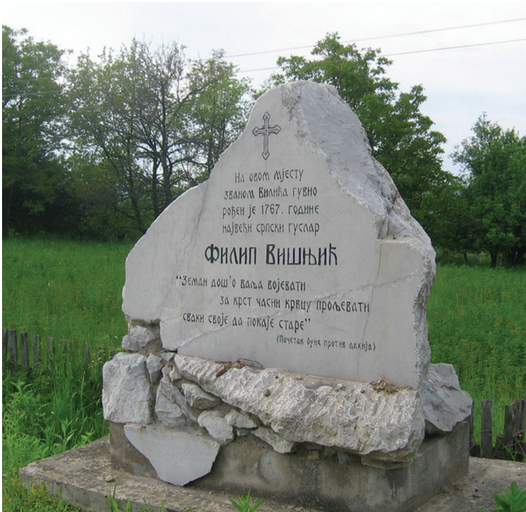
Сл. 7: Споменик Филипу Вишњићу у Трнави

Хвала „Зори“ и омладини, кад изведоше, што наумише! Хвала Митровчанима и Грчанцима, што потпомогоше омладину и српски госте дочекаше! Хвала српском народу, што прихвати и одазва се позиву своје омладине! Нешто бисмо приметили, што нас је немилу дирнуло поводом говора заступника омладине у овој прилици на банкету, а већ и од дуге времена у разним приликама оваковим; али – омладина је осетљива. Теши нас, што смо се и опет уверили, да зна искупити своју реч, кад је зада, и што уме да цени и штује, што је за штовање. То нам јемчи, да ће знати заменити гусларе науком и знањем у свом раду, па се – ћ.