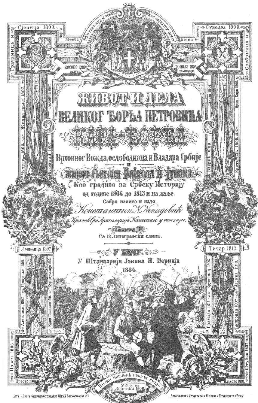
Сл. 5: Филип Вишњић пева уз гусле у Боју на Лозници 1808. године