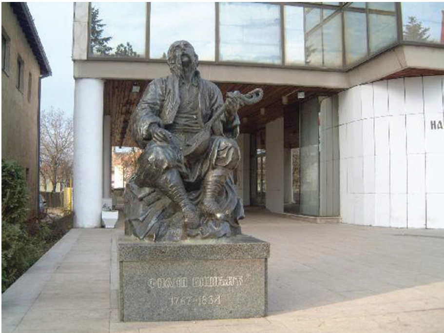
Сл. 3: Споменик Филипу Вишњићу испред Народне библиотеке у Бијељини